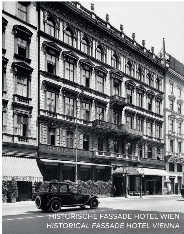
HISTORISCHE FASSADE HOTEL WIEN HISTORICAL FASSADE HOTEL VIENNA