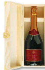
ORIGINAL SACHER CUVÉE 0,75l..... €34,90 Original Sacher Cuvée