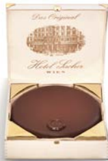
ORIGINAL SACHER-TORTE Größe III..... €58,90 Original Sacher-Torte size III

Take your Sacher experience home with you. The Original Sacher products are available for you in our shops in Vienna or Salzburg, as well as in our online shop at shop.sacher.com.