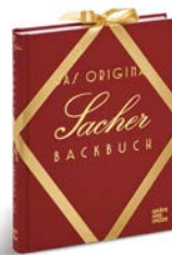
ORIGINAL SACHER BACKBUCH..... €24,99 Original Sacher Book of Baking